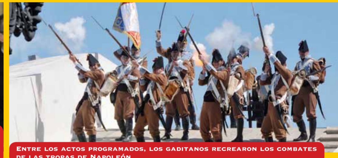
ENTRE LOS ACTOS PROGRAMADOS, LOS GADITANOS RECREARON LOS COMBATES DE LAS TROPAS DE NAPOLEÓN