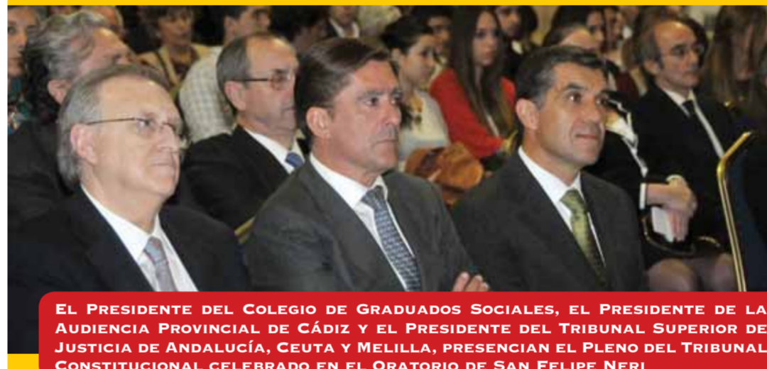
EL PRESIDENTE DEL COLEGIO DE GRADUADOS SOCIALES, EL PRESIDENTE DE LA AUDIENCIA PROVINCIAL DE CÁDIZ Y EL PRESIDENTE DEL TRIBUNAL SUPERIOR DE JUSTICIA DE ANDALUCÍA, CEUTA Y MELILLA, PRESENCIAN EL PLENO DEL TRIBUNAL CONSTITUCIONAL CELEBRADO EN EL ORATORIO DE SAN FELIPE NERI