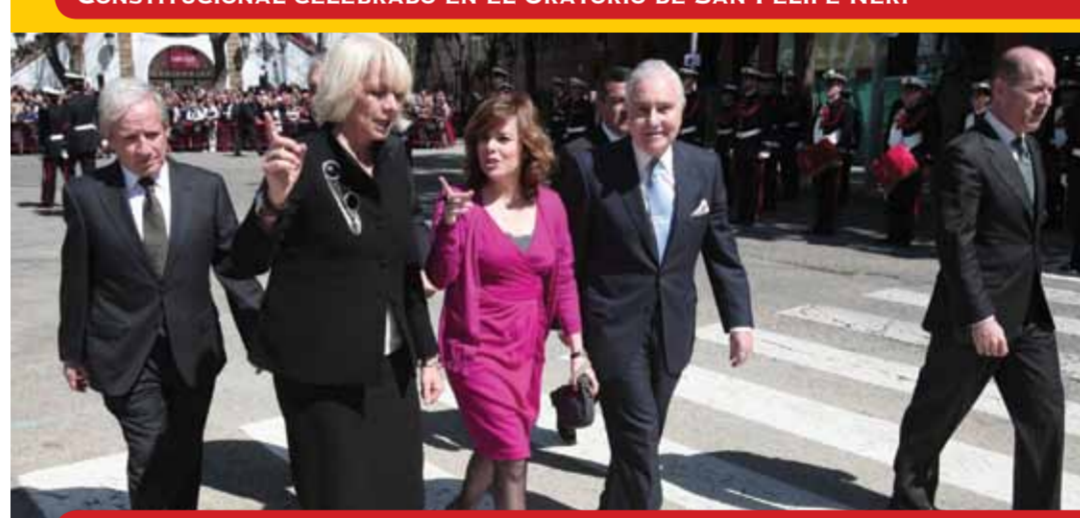
EL PRESIDENTE DEL TRIBUNAL CONSTITUCIONAL, LA ALCALDESA DE CÁDIZ, LA VICEPRESIDENTA 1ª DEL GOBIERNO DE ESPAÑA Y EL PRESIDENTE DEL TRIBUNAL SUPREMO SE DIRIGEN AL MONUMENTO A LAS CORTES DE CÁDIZ EN EL QUE SSMM LOS REYES HICIERON UNA OFRENDA FLORAL