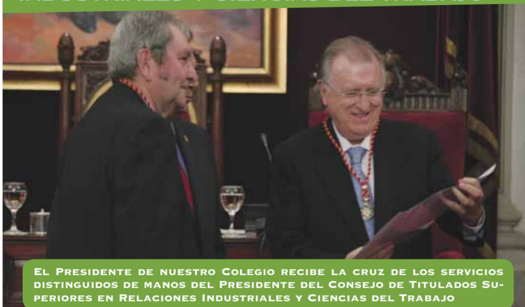
EL PRESIDENTE DE NUESTRO COLEGIO RECIBE LA CRUZ DE LOS SERVICIOS DISTINGUIDOS DE MANOS DEL PRESIDENTE DEL CONSEJO DE TITULADOS SUPERIORES EN RELACIONES INDUSTRIALES Y CIENCIAS DEL TRABAJO

El Consejo de Titulados Superiores en Relaciones Industriales y Ciencias del Trabajo de España (CGRIT) hizo entrega el 27 de abril, en el Salón de Plenos del Ayuntamiento de Cádiz, de diversas distinciones a personalidades relacionadas con dichas titulaciones. La ciudad de Cádiz y nuestro Presidente fueron galardonados con la Cruz de los Servicios Distinguidos en las Relaciones Industriales y Ciencias del Trabajo.