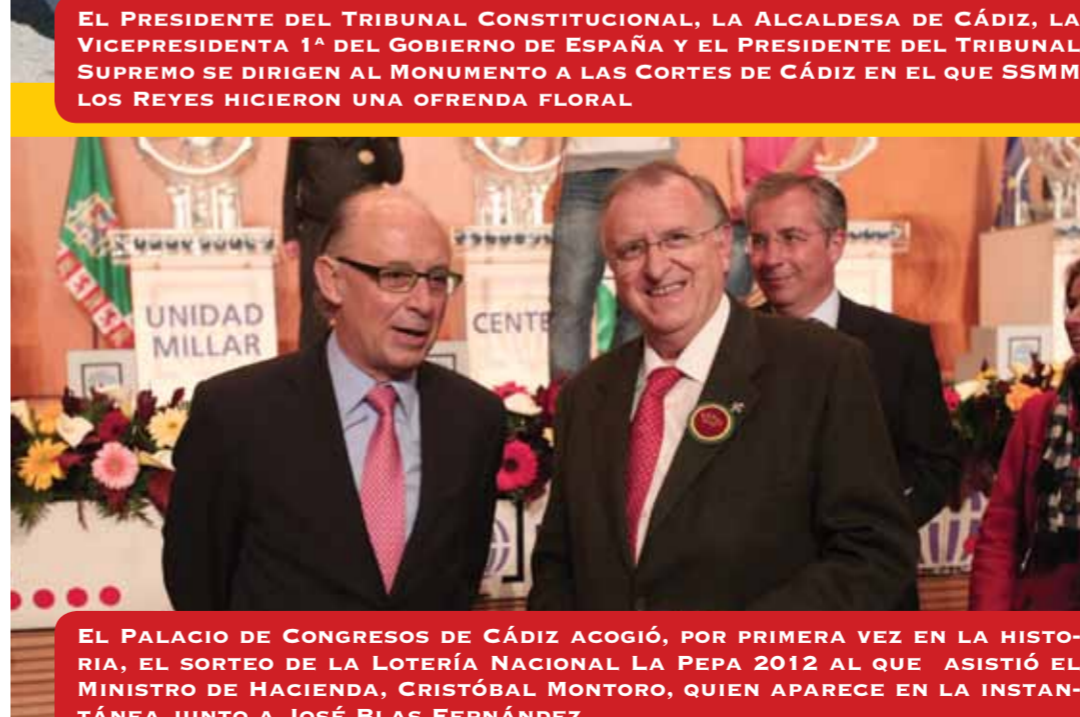
EL PALACIO DE CONGRESOS DE CÁDIZ ACOGIÓ, POR PRIMERA VEZ EN LA HISTORIA, EL SORTEO DE LA LOTERÍA NACIONAL LA PEPA 2012 AL QUE ASISTIÓ EL MINISTRO DE HACIENDA, CRISTÓBAL MONTORO, QUIEN APARECE EN LA INSTANTÁNEA JUNTO A JOSÉ BLAS FERNÁNDEZ