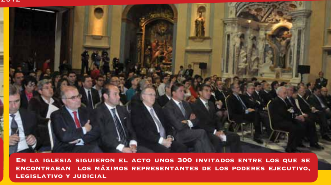
EN LA IGLESIA SIGUIERON EL ACTO UNOS 300 INVITADOS ENTRE LOS QUE SE ENCONTRABAN LOS MÁXIMOS REPRESENTANTES DE LOS PODERES EJECUTIVO, LEGISLATIVO Y JUDICIAL