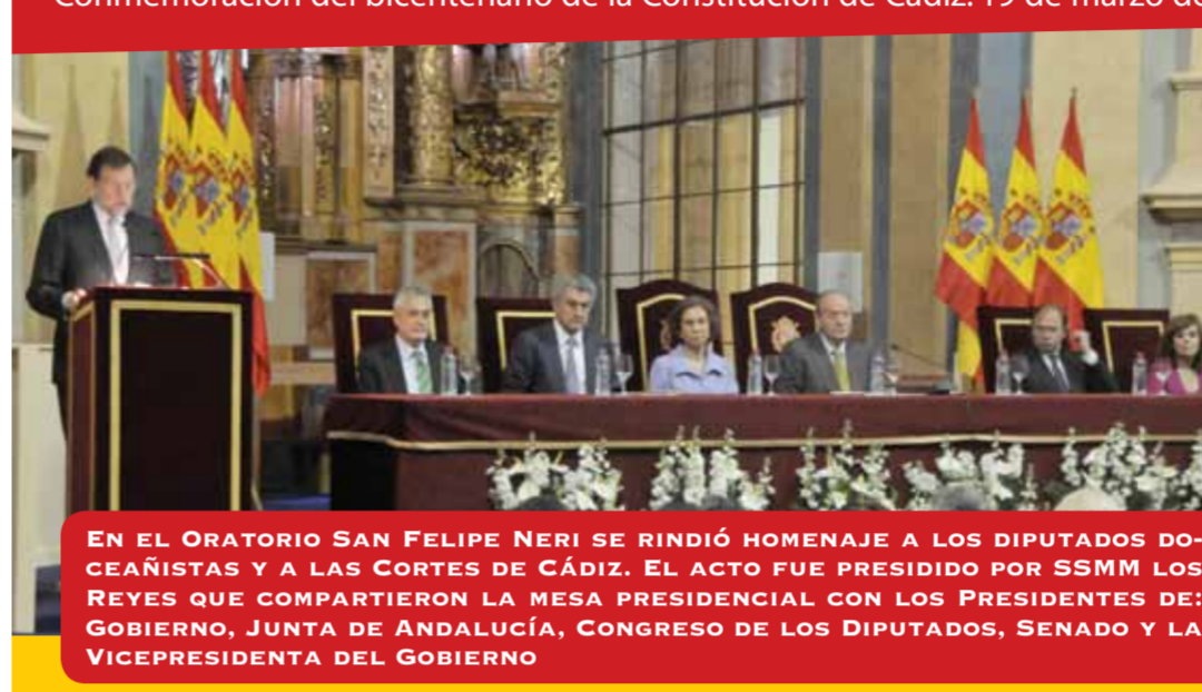
EN EL ORATORIO SAN FELIPE NERI SE RINDIÓ HOMENAJE A LOS DIPUTADOS DOCEAÑISTAS Y A LAS CORTES DE CÁDIZ. EL ACTO FUE PRESIDIDO POR SSMM LOS REYES QUE COMPARTIERON LA MESA PRESIDENCIAL CON LOS PRESIDENTES DE: GOBIERNO, JUNTA DE ANDALUCÍA, CONGRESO DE LOS DIPUTADOS, SENADO Y LA VICEPRESIDENTA DEL GOBIERNO

Commemoración del bicentenario de la Constitución de Cádiz: 19 de marzo de 2012